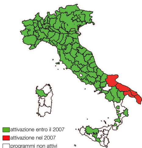
Figura 1. Diffusione dei programmi di screening entro il 2007 (in verde) e nuove attivazioni anno 2007 (in rosso).

• l'estensione effettiva, che rappresenta invece la quota di donne che risulta avere ricevuto effettivamente un invito nell'anno in esame sulla base dei dati inviati al GISMa.